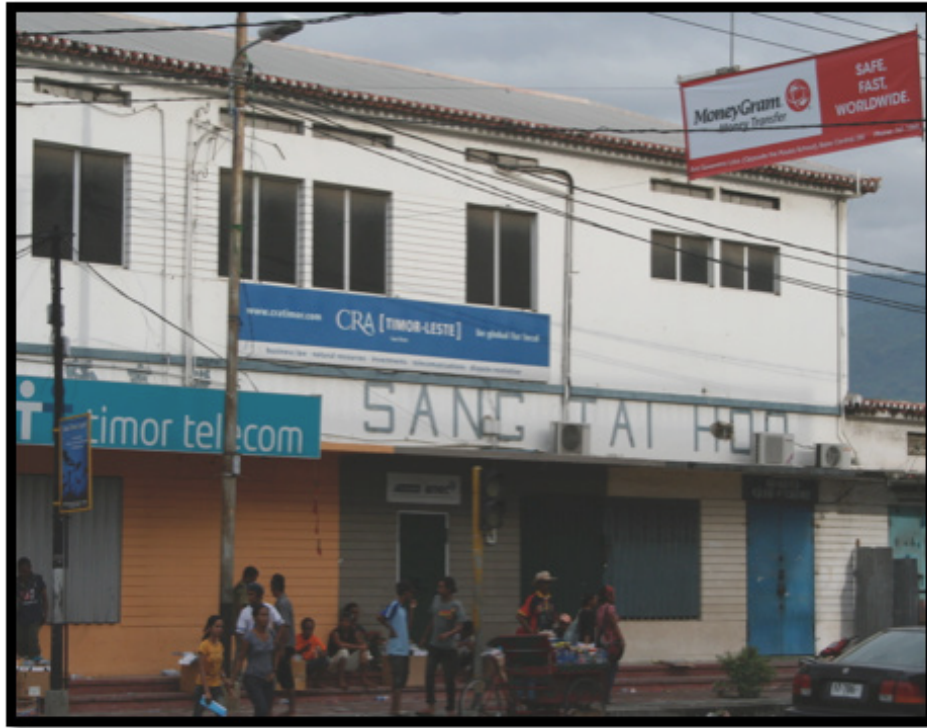
Sentru Tortura ida iha tempu okupasaun Indonesia, kruzamentu Kolmera Dili.

ha'lakon konxiénsia, xoke ho eletrisidade, tortura ho animál sira ne'ebé letál hanesan samea sira ho nehan ne'ebé kro'at, izolamentu, abuzu seksuál, tara, dada ho karreta, violasaun seksuál (dala-balu iha membru família sira no prizoneiru sira seluk nia oin), no eskravidaun seksuál ka "kazamentu forsadu 5 ." Timor-Leste ninian komisaun lialoos (CAVR) konsta katak "forsa seguransa Indonézia no sira-nian auxiliár sira komete, enkoraja no tolera ba tortura no tratamentu a'at ne'ebé jeneralizada no sistemátika hasoru vítima sira 6 ."